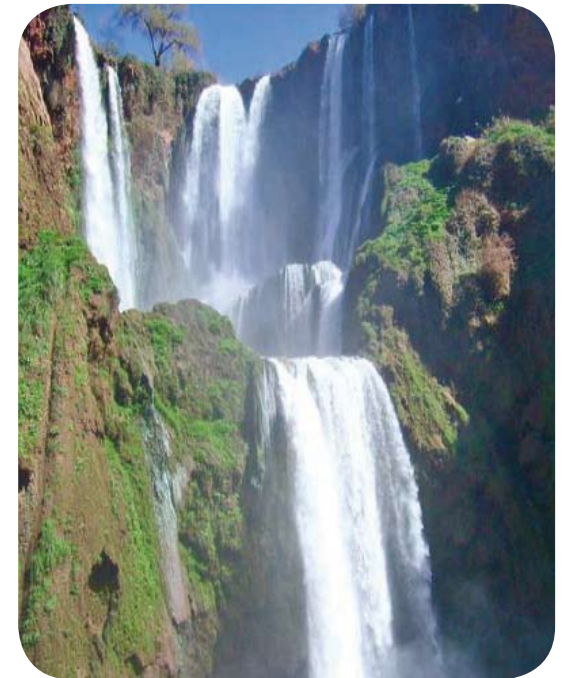
Eine Quelle, die nie versiegt!

A 81, Stuttgart-Singen Ausfahrt »Gärtingen« oder »Herrenberg«